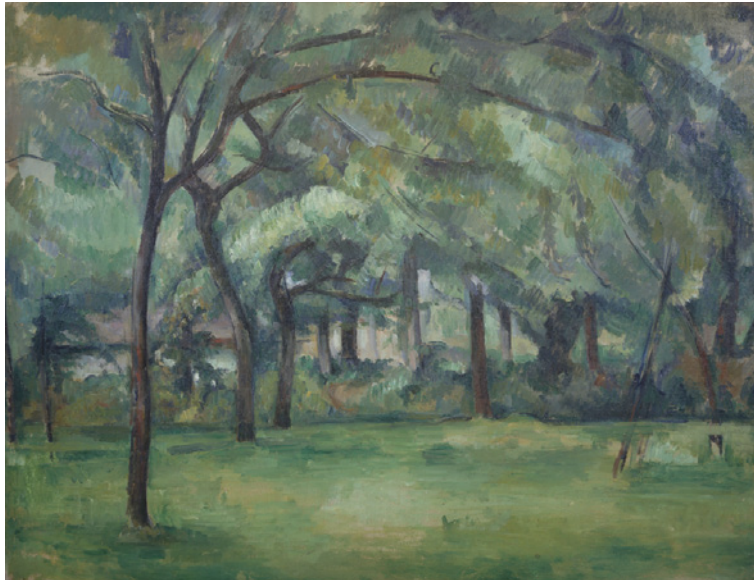
12 Paul Cézanne Ferme normande, été (Hattenville) 1882 Öl auf Leinwand 49,5×66 cm Privatbesitz, Dauerleihgabe an The Courtauld Gallery, London