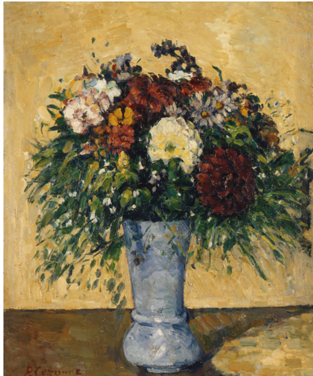
8 Paul Cézanne Fleurs dans un vase um 1877 Öl auf Leinwand 55,2×46 cm Staatliche Eremitage, Sankt Petersburg