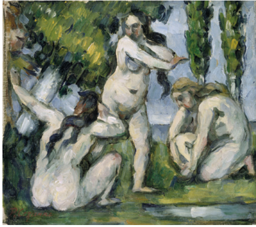
7 Paul Cézanne Trois baigneuses 1874–1875 Öl auf Leinwand 19,5×22,5 cm Musée d'Orsay, Paris