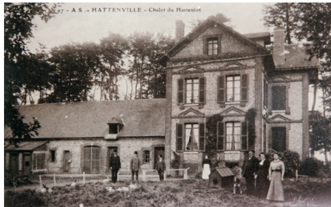
11 Historische Postkarte mit der Ansicht von Chocquets Anwesen in Hattenville