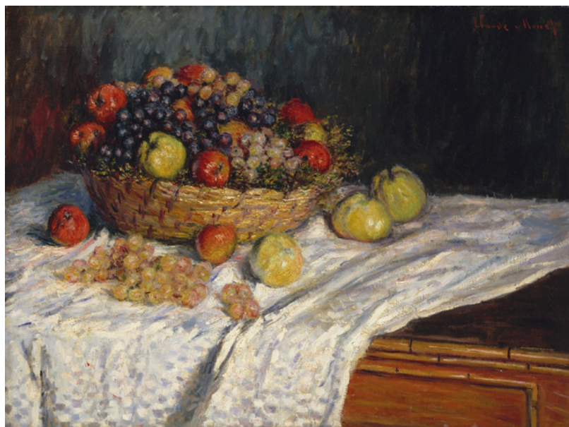
18 Claude Monet Corbeille de fruits (pommes et raisin) 1879 Öl auf Leinwand 68×90 cm The Metropolitan Museum of Art, New York, Geschenk von Henry R. Luce, 1957