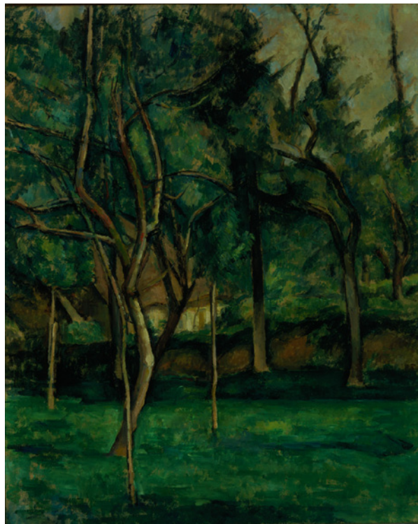
13 Paul Cézanne Le Verger (Hattenville) 1882 Öl auf Leinwand 61×50 cm Thyssen-Bornemisza Collections