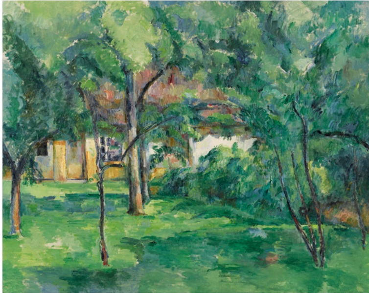
10 Paul Cézanne Ferme en Normandie, été (Hattenville) 1882 Öl auf Leinwand 65×81 cm Privatbesitz