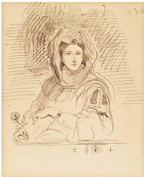
17 Eugène Delacroix L'Algérienne à la rose (Pauline Villot in algerischem Kostüm) um 1833 Feder und braune Tusche 18,5×15,5 cm Thaw Collection, The Morgan Library & Museum, New York